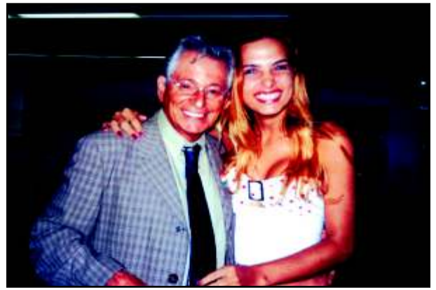
Deputado Fernando Gabeira no lançamento da campanha "Travesti e Respeito", Brasília (DF)