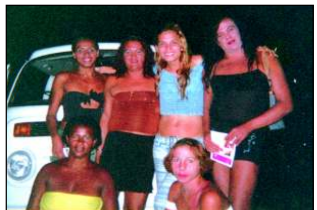
Garotas da BR em intervenções da ASTRA